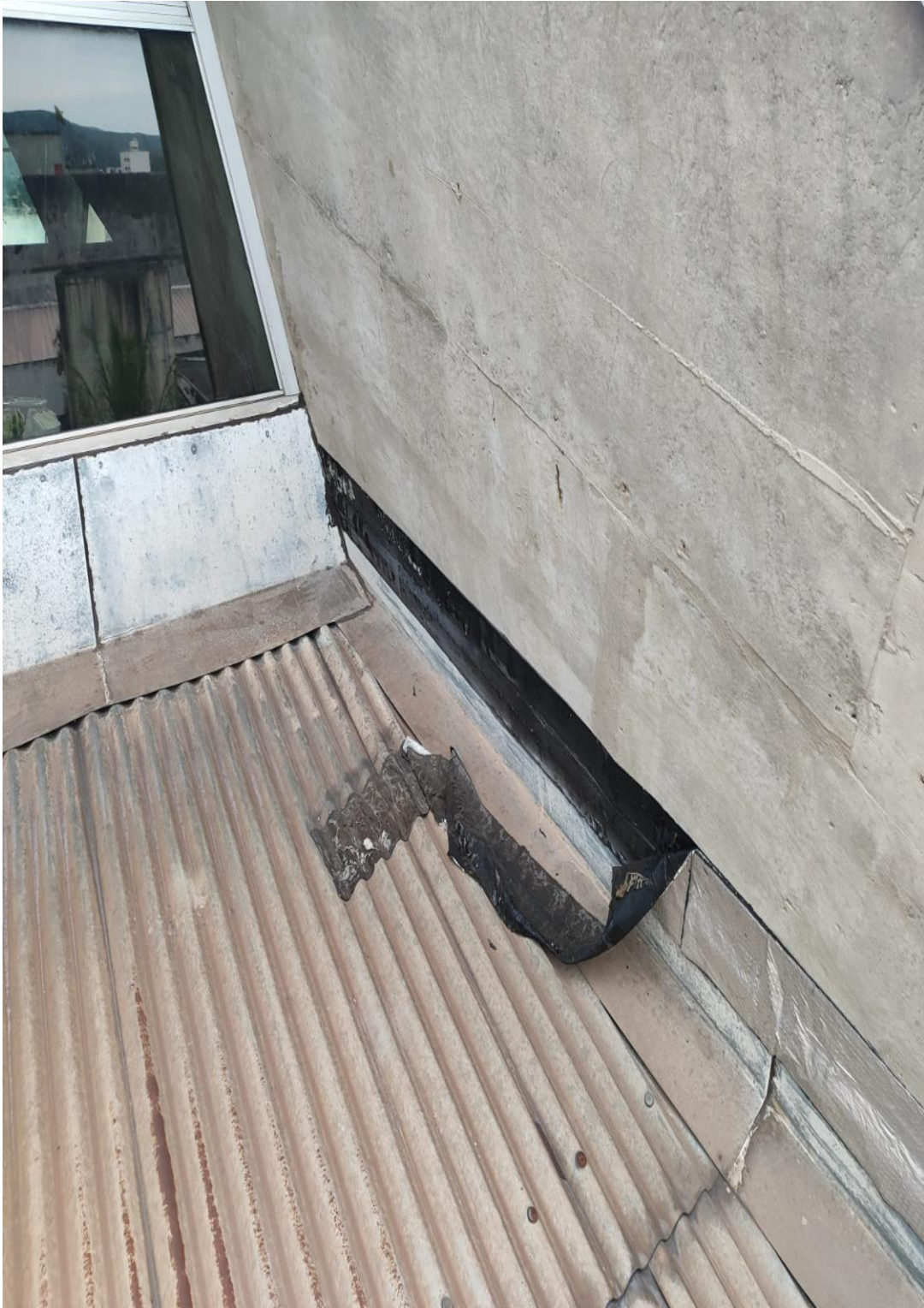
Manta danificada nos rufos