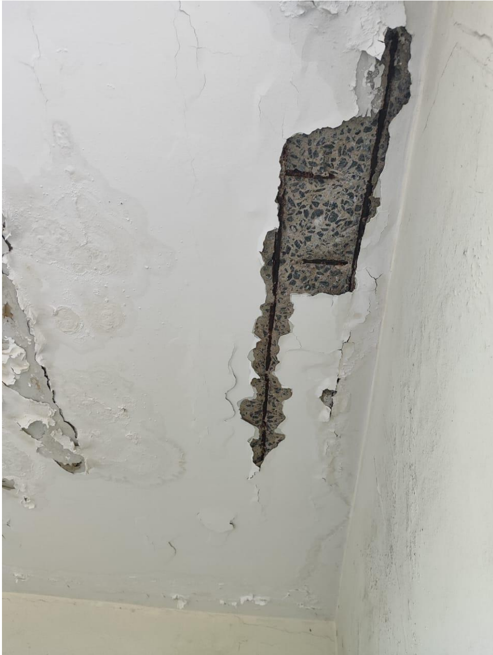
Laje da escada superior