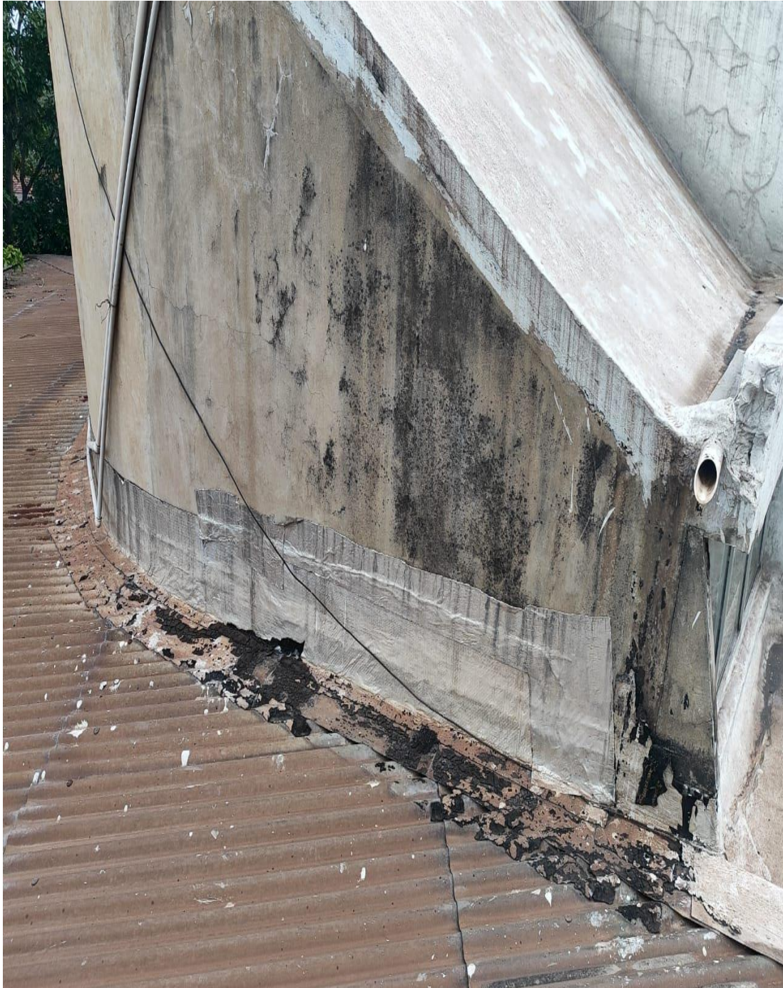
Base da Caxia d'água