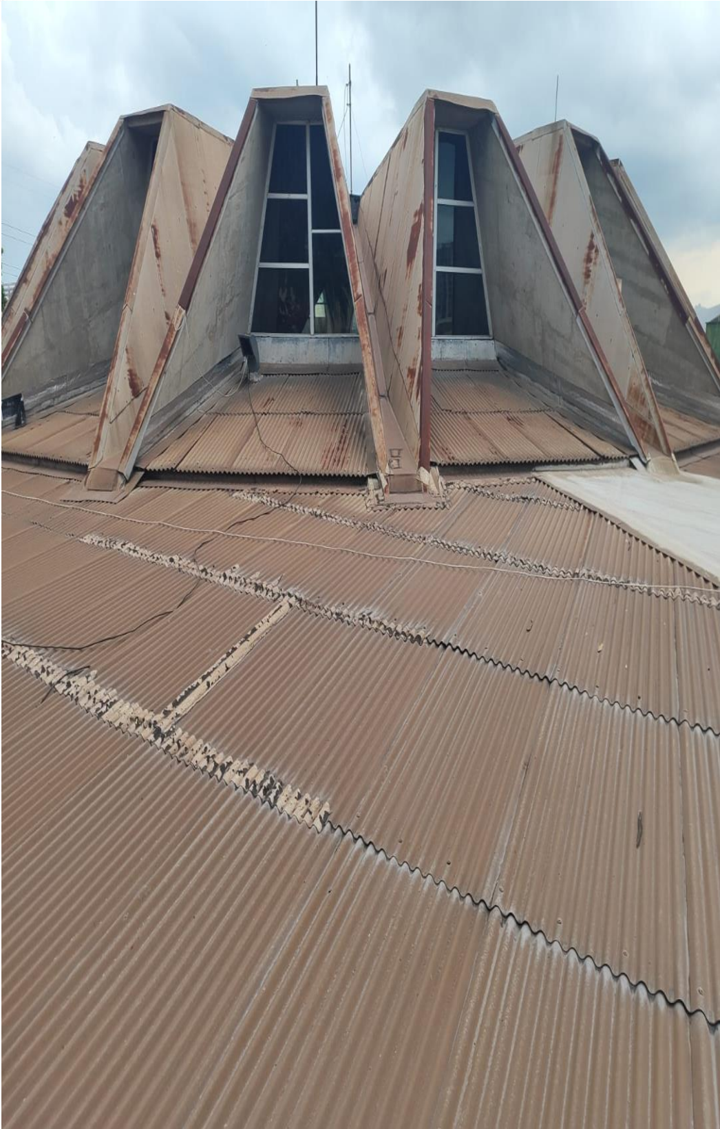
Inúmeros pontos de corrosão