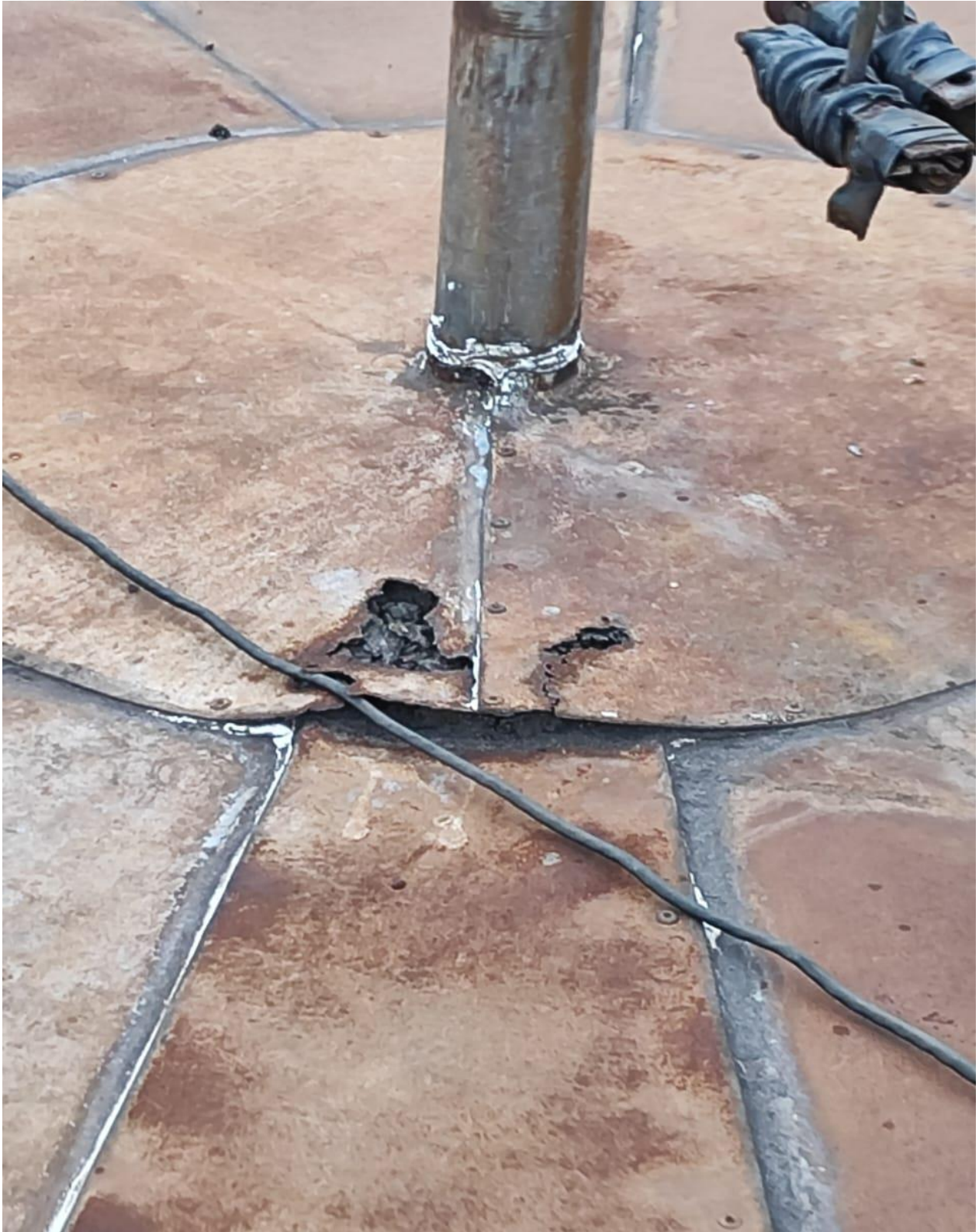
Base do para ráio