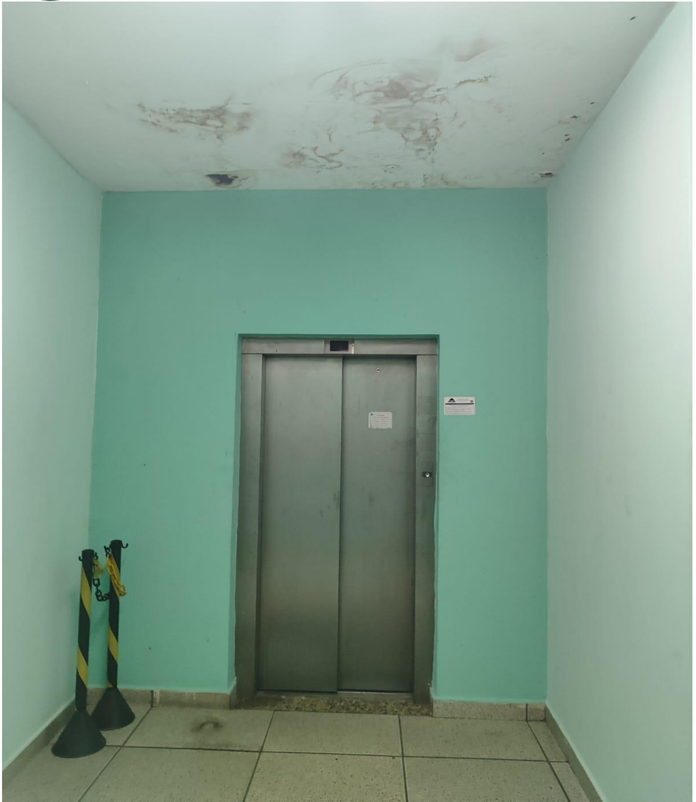
Hall do elevador. Dano no teto com consequências no piso