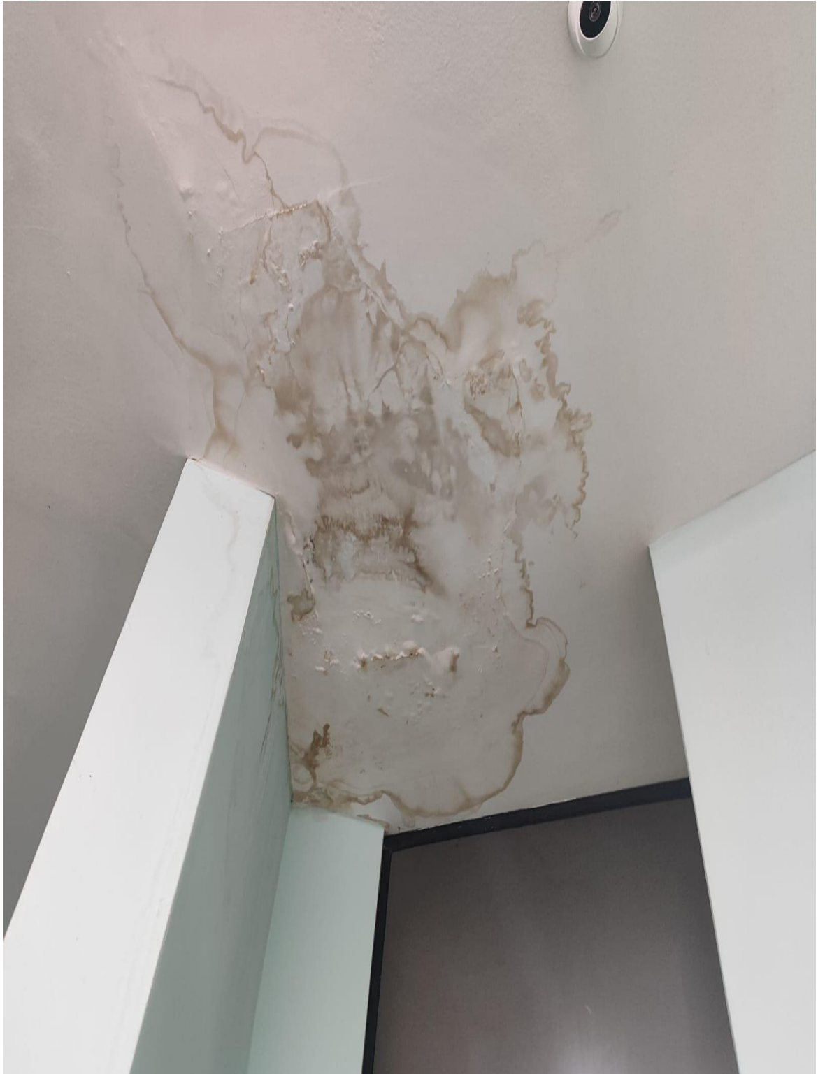
Infiltração e dano no gesso em frente ao gabinete do Ver. Edson Carlos Quinto