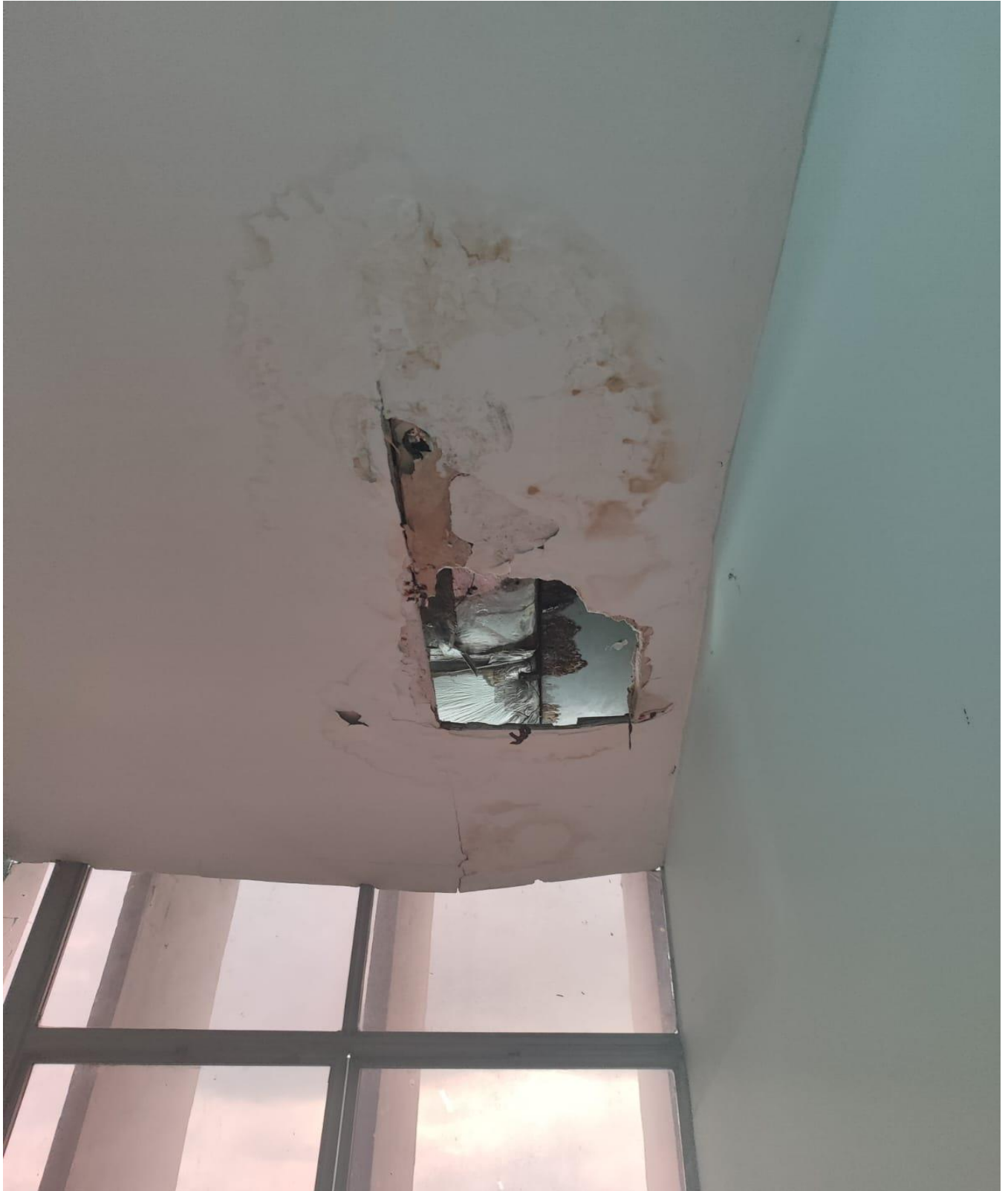
Infiltração e dano no gesso em frente ao gabinete do Ver. Rodrigo Furtado