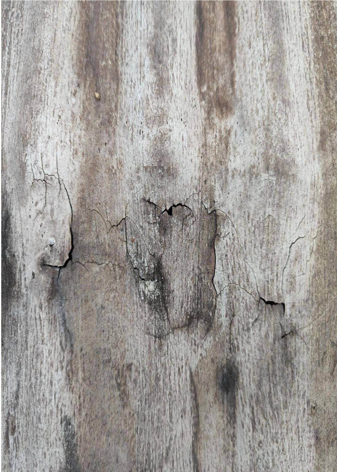
Desgaste na antiga Impermeabilização