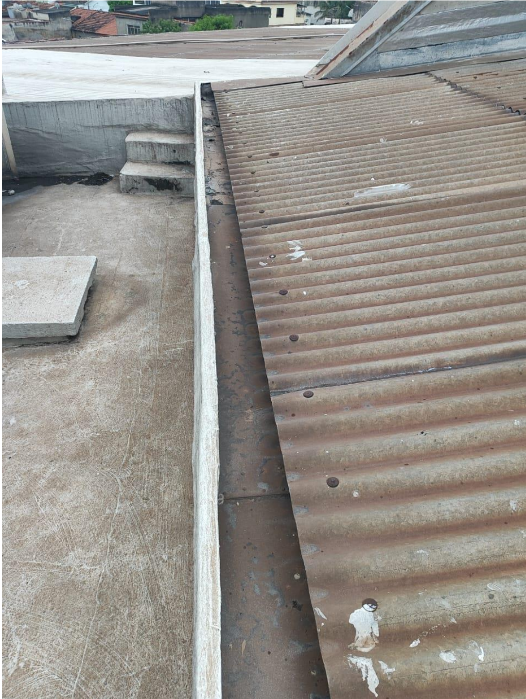
Calha de captação