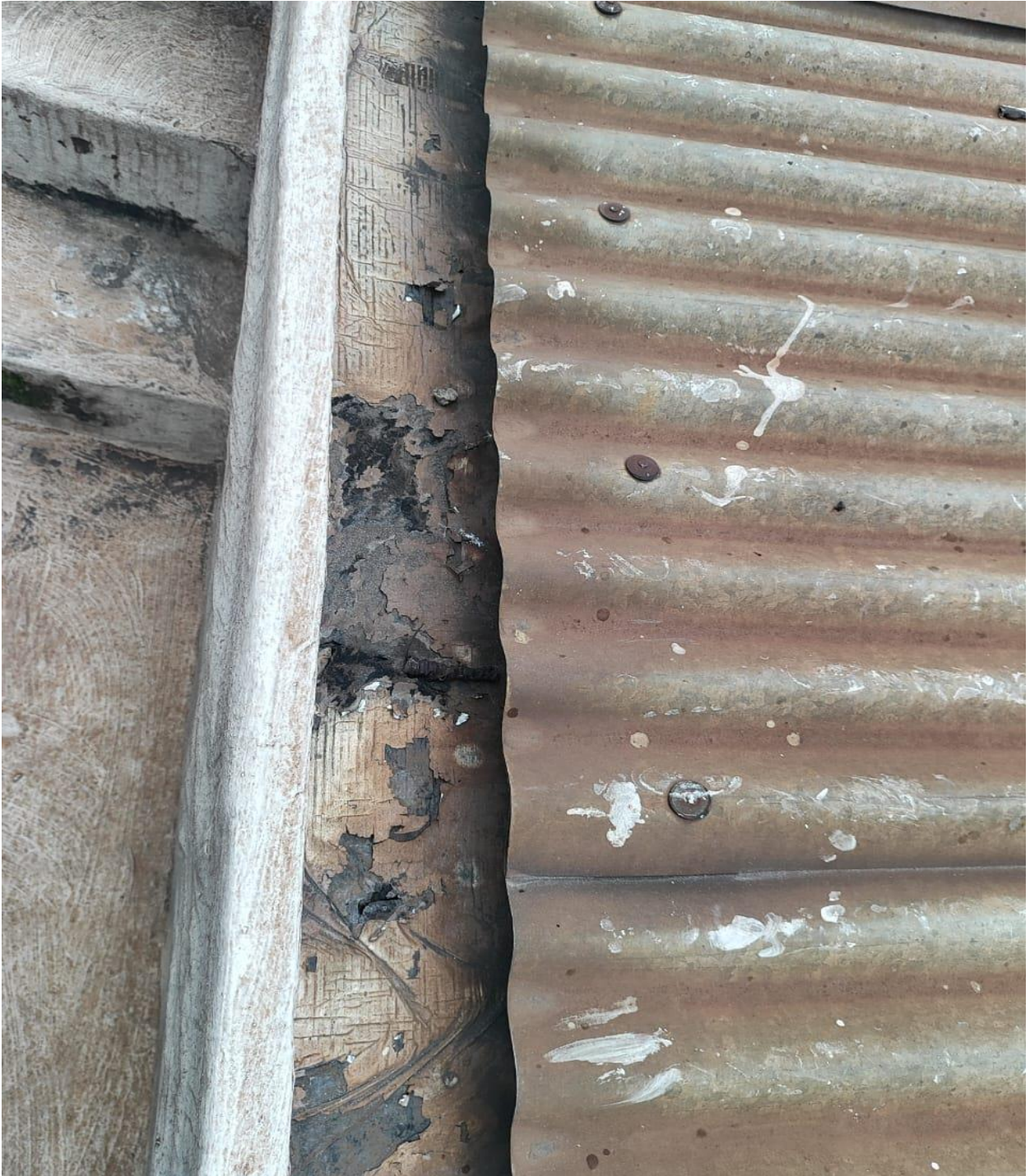
Calha de captação